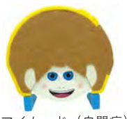
マイムード (自閉症)

ママ・メイド・トイは、プラントイのデザイナーが、障がい児をもつお母さんや発達の専門家と一緒に開発した療育のためのおもちゃです。現場でお役立ていただければ嬉しいです。(プラントイジャパン株式会社様より)