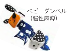
ベビーダンベル (脳性麻痺)