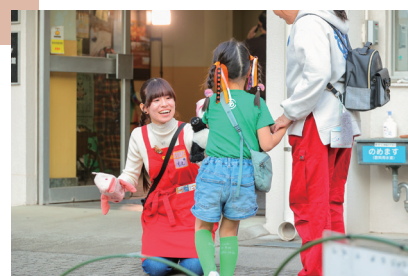
▲おもちゃまつりサポーターの活動の様子

一緒にイベントを盛り上げてくれる実行委員、サポーターを募集しています。興味のある方、参加希望の方は、右のQRコードの応募フォームよりご連絡ください。