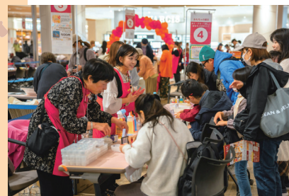
▲「九州おもちゃまつり」出展ブースの様子