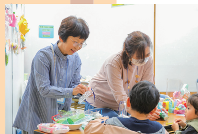
▲「東京おもちゃまつり」出展ブースの様子

パフォーマンスや読み聞かせ、遊びの体験など、発表・体験をしてもらいたいものの出展も可能です。