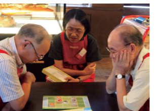
アナログゲームの習得