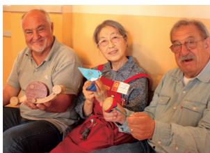
外国人のお客様へおもてなし