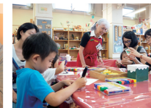
おもちゃ作りのサポート